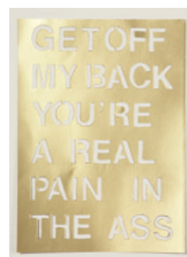
Die halbe Reise , 2008–2009 left to right: Nr. 030, 033, 044, 046, 070, 118. Collage, Mixed Media, 25 × 18 cm each.

1969 geboren in Mülheim an der Ruhr. 1994 bis 2002 Studium der Bildenden Kunst und Meisterschüler an der Hochschule für Grafik und Buchkunst Leipzig . Seit 2000 lebt und arbeitet Marcel Bühler in Berlin. Diverse Ausstellungen im In- und Ausland, zuletzt