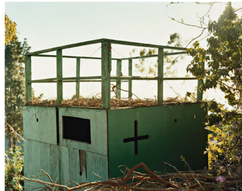
Welcome home , Los Angeles, 2006 Wallpaper, Inkjet, 2,84 × 13 metres