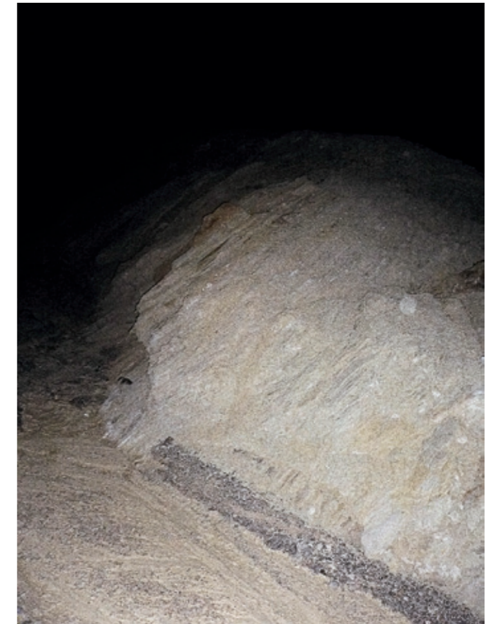
Zabriskie Point , 2010 80 photographs, each 29 × 21 cm Inkjet print